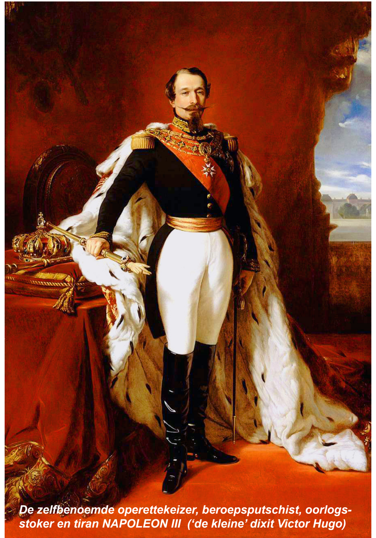
De zelfbenoemde operettekeizer, beroepsputschist, oorlogstoker en tiran NAPOLEON III ('de kleine' dixit Victor Hugo)

De 400.000 ter ziele getogenen waren voor 50% Russen, die hiermee de rekening betaalden voor het beledigen van NAPOLEON I ('De Groote') en zijn 'grande armée' aan de BEREZINA in 1812... wat erop wijst dat de Fransen extra gevoelig zijn voor beledigingen die desnoods generaties lang zorgzaam gekoesterd worden.